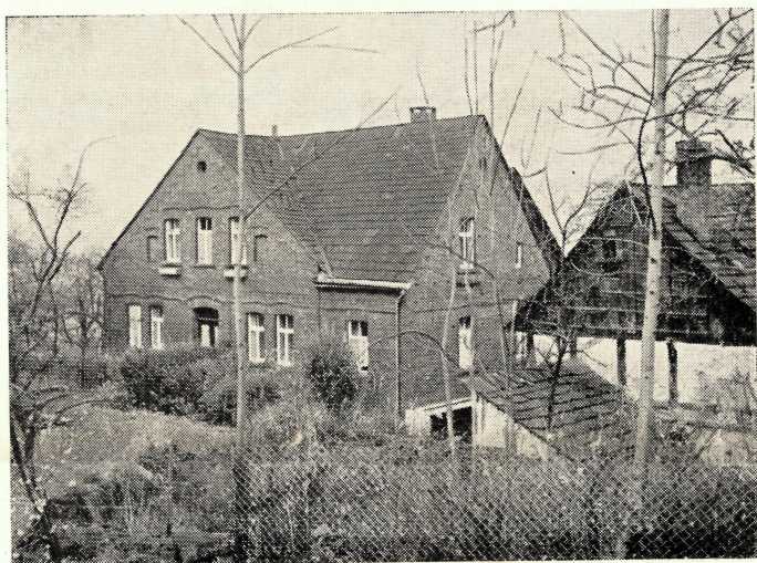
Wohnhaus der Bornelsmühle in Meinbrexen/Weser